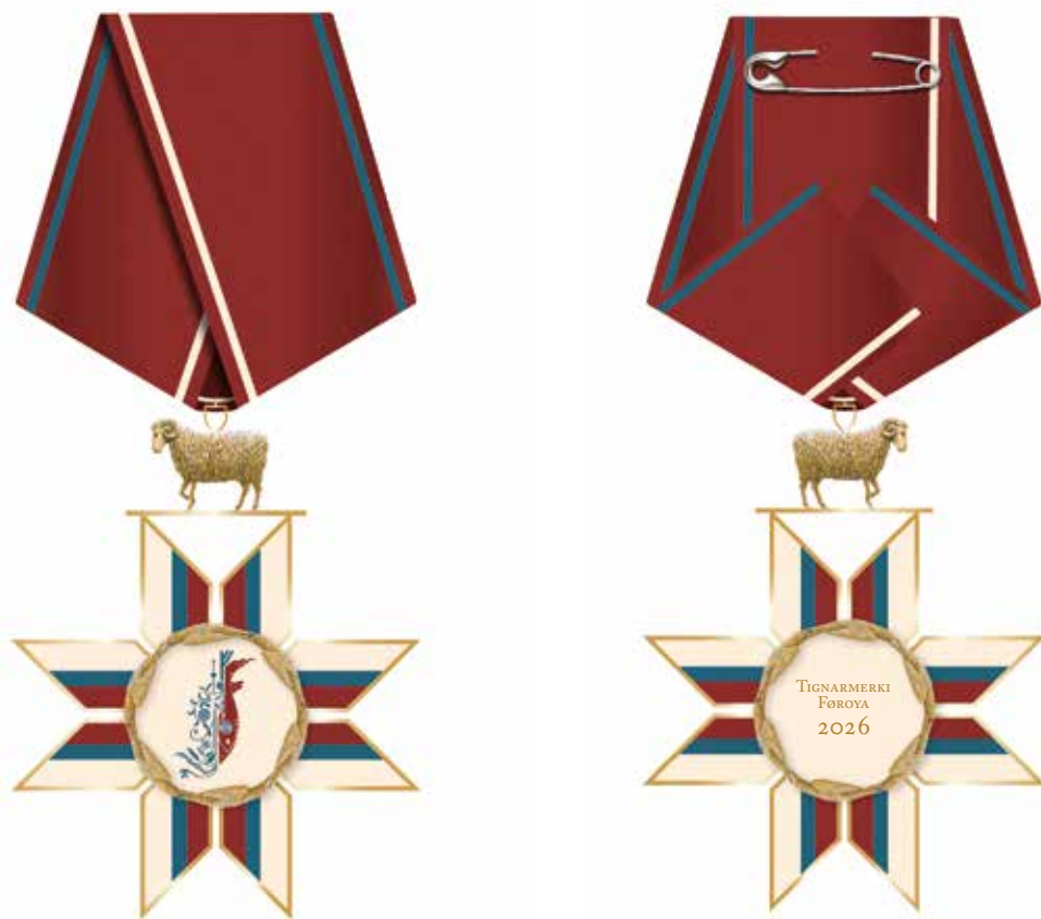
TEKNING 5 Uppskot til Tignarmerki Føroya í stødd 1:1