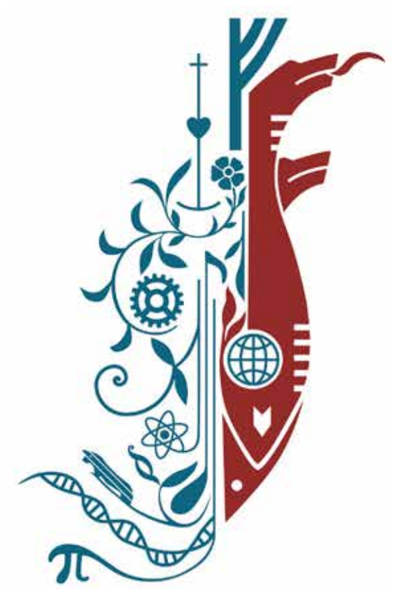
TEKNING 4 Uppskot til smámyndina í Tignarmerki Føroya