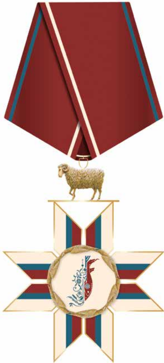
TEKNING I Uppskot til framsíðu á Tignarmerki Føroya