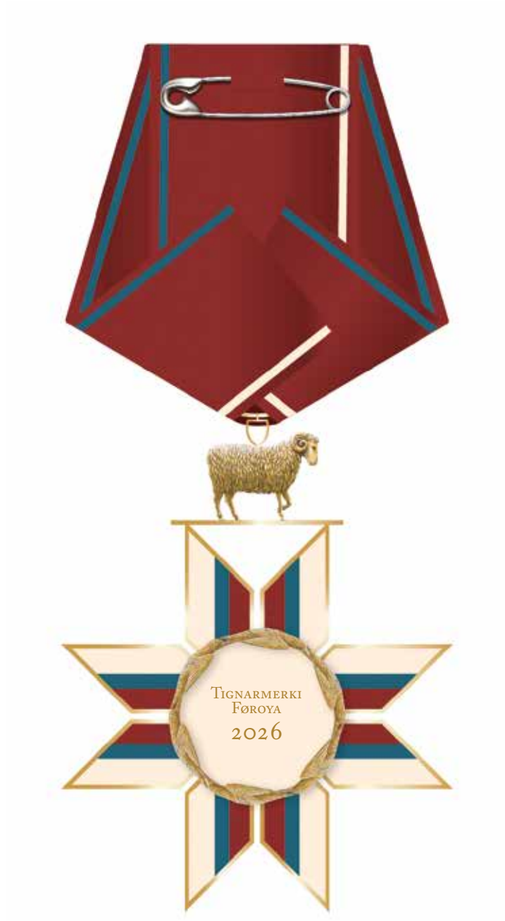
TEKNING 2 Uppskot til baksíðu á Tignarmerki Føroya