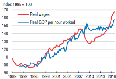
Mynd 3. Hækkingin í lönunum er økt meira enn vøksturinn í framleiðni seinastu árinu.

Fíggjarstöðan í Íslandi er vorðin munandi betri eftir fíggjarkreppuna. Ísland hefur havt avlop á fíggjarlógini tey seinastu árinu og hefur minkað munandi um skuldina hjá ríkiskassanum.