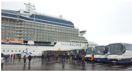
Mynd 6. Havnirnar í Faxaflóahavnum (í Reykjavíkarokinum) vilja krevja ferðafólkaavgjald frá ferðafólum við skemtiferðaskipum og teimum, sum ætla av huggja at hvalum.