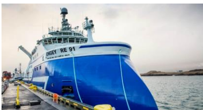
Mynd 7. Roknað verður við, at 10 nýggir trolarar koma til Íslands í ár. Her sæst nýggi trolarin hjá HB Grandi, Engey, sum kom til landið við ársbyrjan.