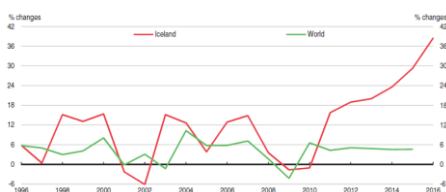
Mynd 2. Ferðavinnan í Íslandi er vaksin nógv síðani 2010. Árligi vøxturin hjá Íslandi er sera høgur.