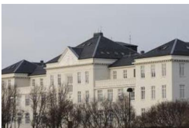
Mynd 4. Landspítali í Reykjavík, ið er eitt universitets sjúkrahús