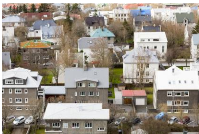
Mynd 7. Íslenskir Airbnb útleigarar fáa munandi størri inntøkur enn aðrir.

Tað, sum er mest óvæntað viðvíkjandi Reykjavík er, at í mun til hvussu lítil høvuðsstaðurin er, samsvarar lutfallið av gestum, sum brúka Airbnb, ikki við aðrar høvuðsstaðir. Í 2015 vóru 1,1 millión Airbnb gestir í Amsterdam og 200.000 gestir í Reykjavík. Amsterdam er seks ferðir so stórir sum Reykjavík, sigur Oskam.