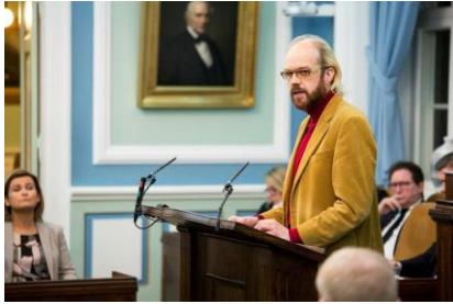
Mynd 5. Óttarr Proppé, heilsumálaráðharrinn