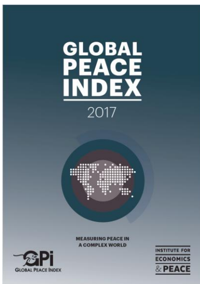
Mynd 6. Ísland er aftur kosið heimsins fríðarligasta land á 10. sinni á rað.