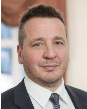
Mynd 1. Guðlaugur Þór Þórðarson, uttanríkisráðharri

Á umhvörvisökinum og innan Arktis. Ein av hornasteinunum í tí íslenska uttanríkispolitikkinum er at verja tað arktiska økið. Áhugi Íslands í stríðnum móti veðurlagsbroytingunum, kemst serliga av árinunum, veðurlagsbroytingarnar hava á havið og lívhválvið kring Ísland.