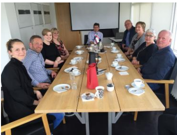
Mynd 9. Borgarstjóri og starvsfólk frá Þorlákshöfn á vitjan