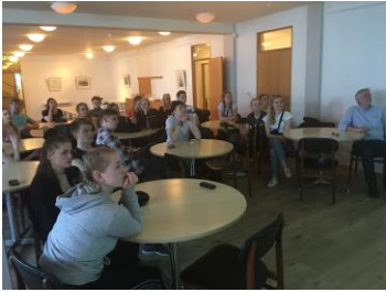
Mynd 8. Næmingar frá Glasi í Hoydølum á vitjan