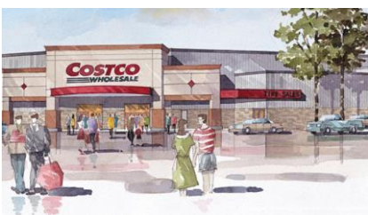
Mynd 6. Fyrsta Costco vøruhúsið í Íslandi opnar 23. mai í Reykjavík