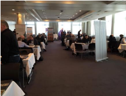
Mynd 7. Frá B2B ráðstevnu á Hotell Hilton í Reykjavík 22. mars.

Føroyskar fyrirtøkur hava vaksandi áhuga í íslenska marknaðinum, nú búskapurin veksur so skjótt í Íslandi, eins og íslenska krónan er styrkt so nógv í virði í seinastuni, at føroyskar fyrirtøkur gerast meira kappingarførar á íslenska marknaðinum.