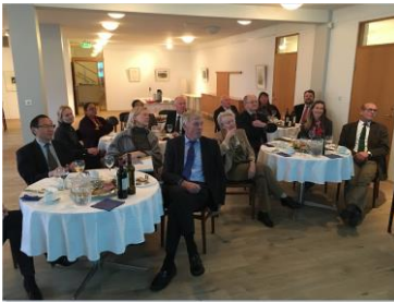
Mynd 11. Nøkur av sendifólkunum og teirra makar lýddu á, meðan sendimaðurin greiddi frá ferðini til FO.

2. november skipaði sendistovan fyri kunningarfundi um ferð til Føroyar í mai á næsta ári fyri sendifólkunum og makum teirra. Stórir áhugi var fyri fundinum og fyri at luttaka í ferðini. Av teimum 16 sendifólkunum, sum eru í Íslandi, hava 13 teirra boðað frá luttøku, og má tað sigast at vera góð undirtøka. Ferðin er frá 19. til 22. mai 2017 og hevur Sendistovan áður skipað fyri slíkum ferðum í 2009 og 2013. Endamálið við hesari ferð er m.a. at vekja størri ans fyri Føroyar, styrkja diplomatisku sambondini millum Føroyar og tær sendistovur, sum eru staðsettar í Íslandi, eins og at styrkja støðuna hjá Sendistovuni í diplomatisku skipanini í Íslandi.