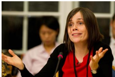
Mynd 3. Katrín Jakobsdóttir, forkvinna í Vinstrihreyfingin - grænt framboð