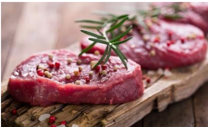
Mynd 7. Stríðið um innflutt feskt kjøt, setti íslenska lóggávu til viks til frama fyri skyldur Íslands sambært EBS sáttmálanum.