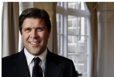
Mynd 4. Bjarni Benediktsson, formaður í Sjálfstæðisflokknum.