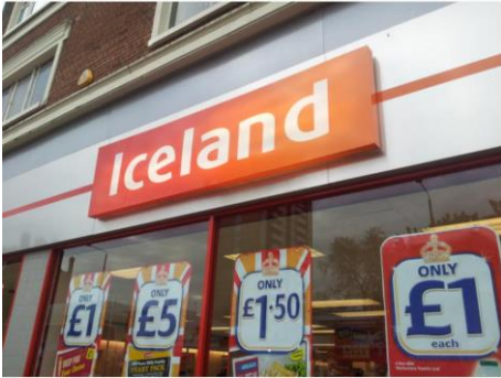
Mynd 8. Iceland Foods hevur elt og vunnið nógv mál móti íslenskum virkjum, sum hava nýtt „Iceland“ í teirra umboðan ella sum part av teirra vørumerki, sjálvst í fornum har vørum ella tænarastur ikki kappast.

Næstan 18% av veljarunum, sum valdu Framsókn í norðureystur valdøminum, strikaðu navnið hjá fyrrverandi forsætisráðharranum út. Sigmundur Davíð fekk tilsamans 817 útstrikingar. Hetta er eitt høgt tal, og sammetast kann við tann, ið fekk næstflestas útstrikingar á Framsóknarlistanum, Þórunn Egilsdóttir, sum varð útstrikað 57 ferðir. Hetta er tó ikki einastu fólkinum, sum vórðu útstrikaði. Millum tey, sum eisini fingur nógvar útstrikingar, var Steingrímur J. Sigfússon hjá Vinstru Grønnum, við 155 útstrikingum, meðan Björn Valur Gíslason, á sama lista, fekk 127.