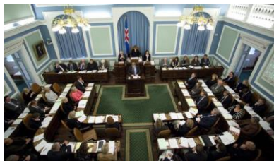
Mynd 3. Altingið.

Tingfólk fáa eisini viðbøtur fyri ymisk arbeiði í Altinginum. Viðbøturnar eru prosent partar av lønini, og hækka tí í takt við lønina. Hesar viðbøtur fáa tingfólk, sum eru formenn fyri tinginum, formaður og varaformaður fyri nevndum, og formenn fyri politisku flokkunum. Tilsamans eru tað 53 av 63 tingmonnum, sum hava fingið hesar viðbøtur. Sostatt kunnu tingmenn fáa millum 1.3 – 2 mió. ISK um mánaðin. Tað er 78.174 – 120.268 DKK.