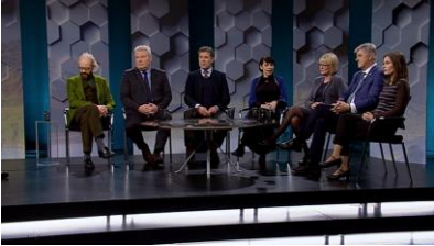
Mynd 2. Floksformenninir í teimum 7 flokkunum, sum eru komnir í Altingið við valið í 2016.

Framsóknarflokkinn - Sigurður Ingi Jóhannsson – vísti somuleiðis á formann Sjálfstæðisflokkin, sum samráðingarleiðara.