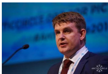
Mynd 5. Løgmaður Aksel V. Johannesen á røðarapallinum á Arctic Circle.