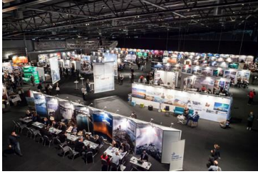
Mynd 6. Vestnorden Travel Mart 2016 í Laugardalshöllini í Reykjavík.