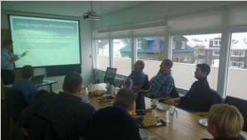
Mynd 7. Nevndin í Føroya Handverksmeistarafelag vitjar Sendistovuna