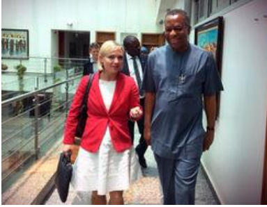
Mynd 2. Lilja Alfreðsdóttir, uttanríkisráðharri Íslands og Geoffrey Jideofor Kwusike Onyeama, uttanríkisráðharri Nigeria eftir loknum fundi í Abuja í Nigeriu.

Íslenski uttanríkisráðharrin, Lilja Alfreðsdóttir, var í seinastu viku á almennari vitjan í Nigeria, har hon hitti fyra ráðharrar úr Nigeriansku stjórnini. Formligt samstarvsøki viðv. handli millum Ísland og Nigeria er í eygsjón, eftir at nigerianski uttanríkisráðharrin á fundi teirra, segði seg stuðla uppskotinum hjá Lilju Alfreðsdóttur um samstarv. Endamálið er at styrkja handilssambandið millum londini, vaxa um handilin sínámillum, og at kanna móguleikan fyri at útflyta íslenskar uppfinningar til Nigeria, m.a. tekniskar loysnir innan fiskivinnu og útgerð.