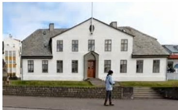
Mynd 3. Íslenska forsætisráðið.