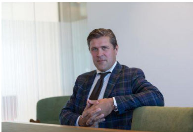
Mynd 4. Íslenski figgjarmálaráðharrin Bjarni Benediktsson.