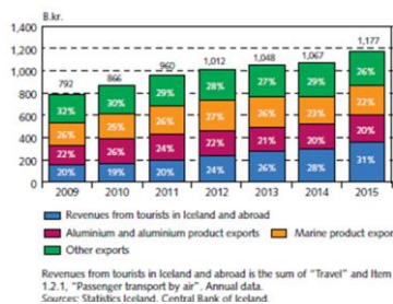
Mynd 3. Yvirlit yfir útflutning av vörum og tænastrum.