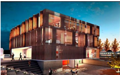
Mynd 8. Nýggi Stovnur Vígdisar Finnboadóttur.