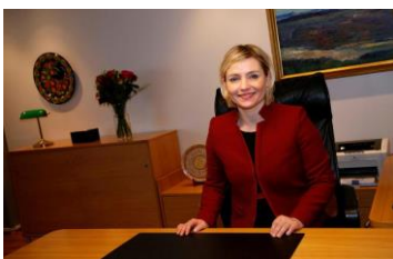
Mynd 1. Íslenski uttanríkisráðharrin Lilja D. Alfredsdóttir