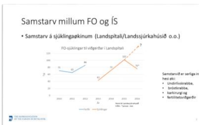
Mynd 2. Yvirlit yvir tal av føroyskum sjúklingum, sum fáa viðgerð í Íslandi