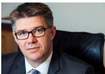
Mynd 5. Íslenski fiskimálaráðharrin Gunnar Bragi Sveinsson