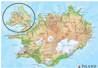
Mynd 4. Vitjað varð í Vestfirðum í byrjanini av mai mánað.