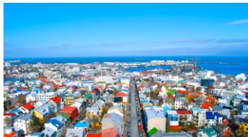
Mynd 3. Ferðavinnan leggur stórt trýst á bústaðarmarknaðin í Reykjavík.