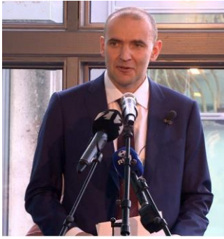
Mynd 2. Guðni Th. Jóhannesson

hefur hann mesta undirtøku millum veljarar hjá Piratunum. Andri Snær fær einans 11% av atkvøðunum, men hóast tað, er hann tað vlevnið, ið fær triðflestar atkvøður í kanningini.