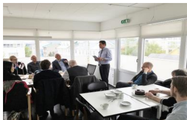
Mynd 5. Biskupur og prestar á vitjan í Sendistovuni.

24. mai var biskupur og prestarnir, ið vóru á vitjan í Íslandi og vitjaði sendistovuna. Sendimaðurin greiddi frá virkseminum hjá sendistovuni. Eisini varð spurt um tilgongdina viðv. yvirtøkuna av fólkakirkjuni, sum sendimaðurin sjálvur hevði staðið fyrri á sinni. Biskupur og prestarnir lótu væl at vitjanini í Íslandi og greiddu frá, at fylgið hevði fingið nógv burturúr. Ætlanin er at styrkja samstarvið millum føroysku og íslensku kirkjuna. Sendistovan bjóðaði seg til at veita hjálp í hesum sambandi. Tað var biskupur fegin um og vildi gera nýtslu av hesum.