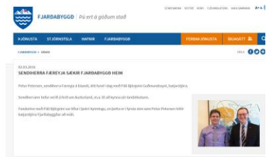
Mynd 5 Sendimaðurin og borgarstjórinn í Reyðarfirði.

Fundirnir við borgarstjórnarnir vóru sera positivir og sendimaðurin fekk eina framúr góða móttøku. So at siga allir ynksku at fáa størri vinnuligt samstarv við Føroyar og