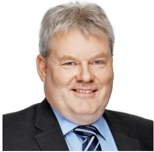
Mynd 1. Nýggi forsætisráðharri Íslands Sigurður Ingi Jóhannsson

Eygleiðarar meta, at Ólafur Ragnar Grímsson hefur góðar móguleikar at vinna komandi forsetaval.