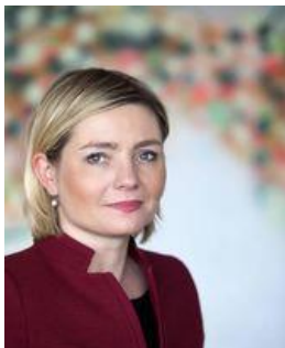
Mynd 2. Nýggi úttanríkisráðharri Íslands Lilja Dögg Alfreðsdóttir

Lilja Dögg Alfreðsdóttir, sum er útbúgvinn innan altjóða búskap og stjórn málafrøði, er vorðin nýggjur uttanríkisráðharri eftir at undanfarni uttanríkisráðharrin, Gunnar Bragi Sveinsson, gjørdist ráðharri í Fiskivinnu- og Landbúnaðarmálum.