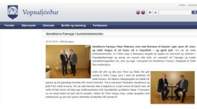
Mynd 6 Sendimaðurin á vitjan í Vopnafirði saman við borgarstjórnunum.