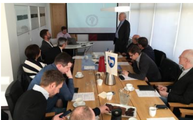
Mynd 4. Brúkararáðið hjá kt-Landsins á fundi í Sendistovuni.

Brúkararáðið fyr Landsnet var á einari kunningarferð í Íslandi í tíðarskeiðnum 12. til 15. apríl fyr at kunna seg um, hvussu íslendingar hava uppbyggt sítt kt-landsnetskervi og loyst sínar kt-avbjóðingar, serliga hjá tí almenna. Sendistovan gjørði eina vitjanarskrá í tøttum samstarvi við Brúkararáðið. Sendistovan fyriskipaði vitjanirnar og hýsti fleiri av fundunum. Vitjað varð m.a.: Innlendismálaráðið, CERT-IS, Tollstjórin, RSK (TAKS), Reiknistofa Bankanna, Advania (fyr Skýrr), Auðkenni, Reykjavíkar kommuna og Fígjarmálaráðið.