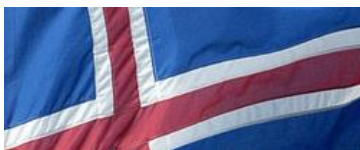
Mynd 1. Íslenska merkið kann nú setast á íslenskar vørur