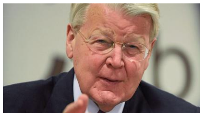
Mynd 2. Íslenski forsetin hevur góðar móguleikar at verða afturvaldur til komandi val.