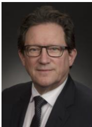
Mynd 8. Kristján Þór Júlíusson, 60 ár, er nýggjur fiski- og landbúnaðarmálaráðharri

Sí meira um Guðlaug Þór Þórðarson her (á íslenskum)