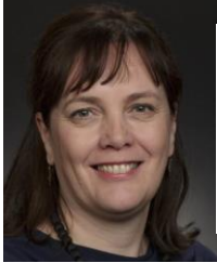
Mynd 11. Svandís Svavarsdóttir, 53 ár, er nýggjur heilsumálaráðharri

Sí meira um Sigríður Á. Andersen her (á íslenskum)