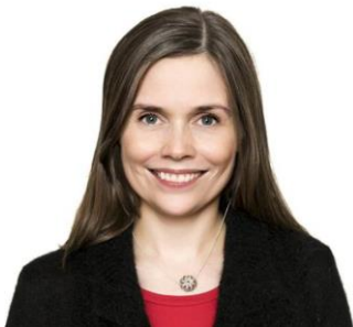
Mynd 4. Katrín Jakobsdóttir, 41 ár, er nýggjur forsætisráðharri.

Sí meira um Katrín Jakobsdóttur her (á íslenskum)