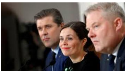
Mynd 2. Bjarni Benediktsson (v.m.), floksformaður fyri Sjálfstæðisflokkin, Katrín Jakobsdóttir, floksforkvinna fyri Vinstra grønu (m.f.) og Sigurður Ingi Jóhannsson (h.m.), floksformaður fyri Framsóknarflokkin.

Sjálfstæðisflokkurin (16), Vinstra grønar (11) og Framsóknarflokkurin (8) tóku síðani upp samband og umrøddu møguleikarnar fyri, at skipa samgongu. Eftir drúgva umrøðu, gjørdur flokkarnir av, at royna at skipa samgongu. Full undirtøka var fyri hesum í Sjálfstæðisflokkinum og Framsóknarflokkinum, men tveir av ellivu altingslimum í Vinstra grønum tóku ikki undir við, at flokkurin skuldi fara í samgongusamráðingur við Sjálfstæðisflokkin. Meðan flokkarnir samráddust, var stórt trýst á Vinstra grøna flokkin, tí eini 200 limir meldaðu seg úr flokkinum, tí teir vóru ónøgdir við, at flokkurin samráddist við Sjálfstæðisflokkin um