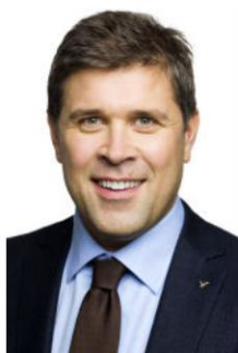
Mynd 5. Bjarni Benediktsson, 47 ár, tekur aftur við sum figgjarmálaráðharri, eftir at hava verið forsætisráðharri.

Hann varð føddur tann 26. januar í 1970 í Reykjavík. Hann fekk bachelorprógv í lögfrøði frá Háskólanum í Reykjavík í 1995, las týskt og lögfrøði í Týsklandi frá