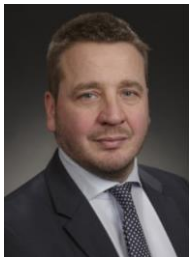
Mynd 7. Guðlaugur Þór Þórðarson, 49 ár, heldur fram sum uttanríkisráðharri.

Sí meira um Sigurð Inga her (á íslenskum)