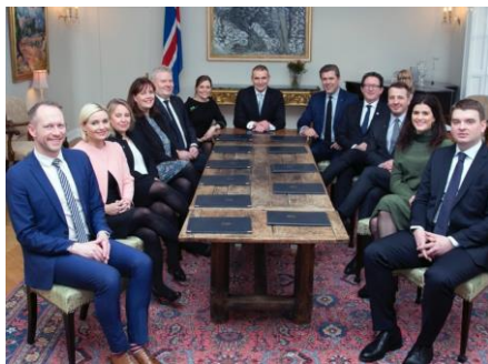
Mynd 1. Ríkisráðsfundur. Nýggja ríkisstjórnin á fundi á Bessastøðum í sambandi við, at hon formliga tók við 30. november.